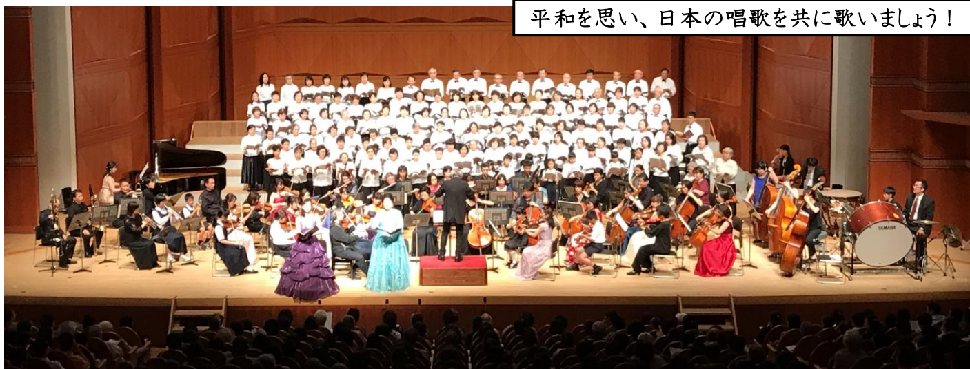
昨年行われた「はつかいち平和コンサート 2019」の様子

「はつかいち平和コンサート」を、今年も「はつかいち音楽祭」のメインコンサートとして行います。「はつかいち平和コンサート2020合唱団」の一員として「平和と共生」への思いを込めて一緒に歌いませんか。