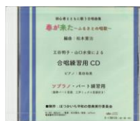
「春が来た」ソプラノ練習用CD